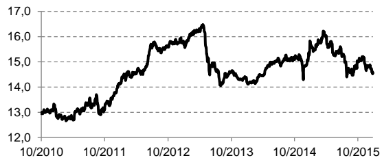
FIM Kehittyvä Korko